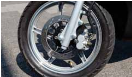
Schijfrem in het voorwiel met een 2-zuigerremklauw.