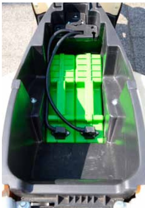
Dubbel en uitneembaar plus opbergruimte onder het zadel.