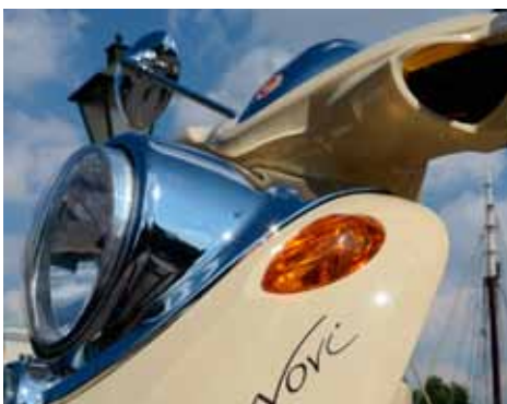
Crème en chroom gaan goed samen bij de Novi.

dellen die elk een bepaalde doelgroep zullen aanspreken. De Novette Twin is het meest neutrale model om te zien maar heeft naast een elektromotor in het achterwiel ook nog een elektromotor in het voorwiel. Voor de sportieve liefhebbers is er de Novum. Een scooter met een zeer moderne vormgeving en ook leverbaar als motorscootervariant. Deze krachtige 5.000W e-scooter heeft een topsnelheid van zo ongeveer 82 km/h. De Novax is tevens voor de sportief ingestelde scooterrijder. Opvallend zijn de grote 14" wielen en de grote koplampunit die verdeeld is in drie aparte units. Dan is er als laatste, de Novi, hoofdrolspeler in deze rijndruk en een echt retro model. Geen replica van de Aprilia Habana/ Honda Shadow maar eentje met grote wielen. We zien hem ook in het gamma van Nimoto en dat is in onze ogen een zeer geslaagd ontwerp. Eens een keer wat anders dan een breed chromen stuur en kleine wielen.