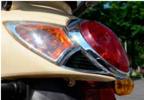
Ook hier komen de ovale vormen terug.

Voordat we de Novi scooter grondig gaan bekijken duiken we even in de geschiedenis van het Emco concern. Opgericht in 1945 door ingenieur Erwin Muller en in 1949 begon het toen nog kleine bedrijf met het produceren van nietmachines. In de jaren '50 begon het bedrijf sterk te groeien en nieuwe activiteiten gingen deel uitmaken van het concern dat nu meer dan 1.000 arbeiders heeft. Actief in badaccessoires, tapijtmatten, zwembadroosters, bureauaccessoire en klimaatregeling. Door de verkregen connecties met de Oosterse markt was de link naar elektrisch transport gauw gemaakt en in 2010 begon de Erwin Muller Gruppe met het leveren van elektrische scooters op de Duitse markt. Inmiddels is Emco uitgegroeid tot de grootste leverancier van elektrische scooters in Duitsland en ze willen nu ook de scooters in Nederland op de markt gaan brengen. Dat doen ze met vier mo-