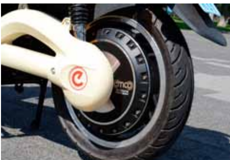
Ook bij de emco zit de motor in het achterwiel.