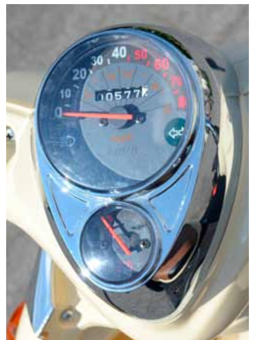
Meer heb je niet nodig.